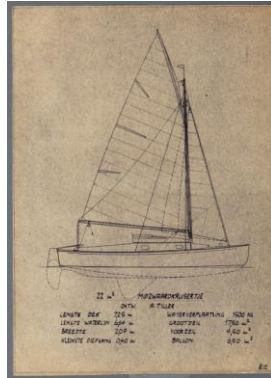
Tekening anno 1943