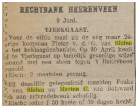
Nieuwsblad van Friesland in 1922